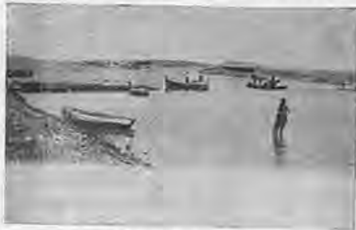
ΤΟ ΒΟΡΕΙΟΝ ΣΤΟΜΙΟΝ ΤΟΥ ΛΙΜΕΝΟΣ ΚΥΔΩΝΙΩΝ ΦΟΥΛΑΠΙ (1)

Η Έλαιοαγορά μας ως εκ της πολιτικής καταστάσεως και του μύχου ἐσχάτων κλεισίματος των Στενών δὲν παρουσιάζει κανὲν σημεῖον ζωηρότητας. Οἱ κάτοχοι Ἑλαίων ἤρχισαν νὰ ἐνδίδωσι εἰς τὸ 67—68 γράσο. τὸ λαγῖνι πρώτης ποιότητος ἑλαιον, ἐὰν δὲ ἡ αὐτὴ πολιτικὴ κατάστασις ἐξακολουθήσῃ αἱ τιμαὶ τῶν Ἑλαίων θὰ ὑποστῶσι νέας ἐκπτώσεις οἱ δὲ πωληταὶ ὡς ἐκ τῶν περιστάσεων θ' ἀναγκασθῶσι νὰ φανώσιν ἐνδοτικώτεροι ἔτι.