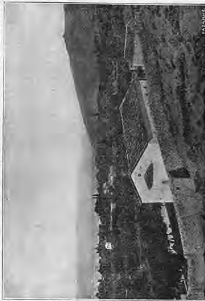
“ΑΓΙΑ ΤΡΙΑΣ” ΠΡΟΑΣΤΕΙΟΝ ΣΜΥΡΝΗΣ ΜΕΤΑ ΤΟΥ ΟΜΩΝΥΜΟΥ Ι. ΝΑΟΥ